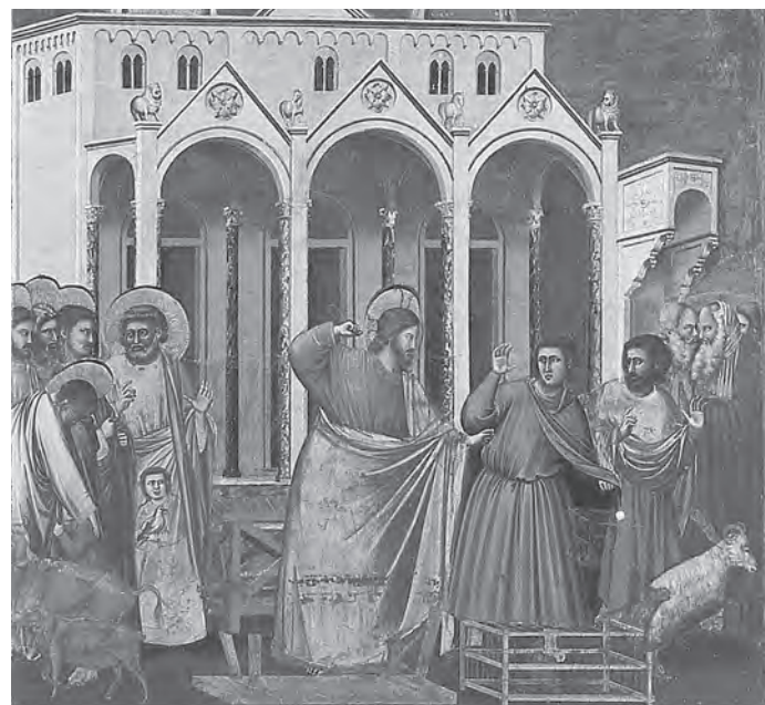
Giotto, Christus vertreibt die Händler aus dem Tempel, Fresco in Padua (um 1305)

Unter Gottesdienst verstand man in Judentum, Hellenismus und heidnischen Kulturen vor allem Opferkult mit Fleisch, Wein und Rauch. Jesus und viele der frühen Christen dürften mit ziemlicher Sicherheit Opfer zum Tempel gebracht haben. Wenn Jesus diese kultische Praxis kritisiert, dann richtet er sich nicht grundsätzlich dagegen, sondern gegen einen sinnentleerten Tempelkult. Im Mittelpunkt des Kultes stand der Priester, der das Opfer still und ohne Wort und Gebet vollziehen konnte. Mit der Zerstörung des Tempels im Jahre 70 n. Chr. entwickelt sich der Gottesdienst vom Opferhandeln hin zum gemeinsamen Nachdenken in der Synagoge und zum gemeinsamen Essen im Haus. Eine Entwicklung hin zu „Wort und Sakrament“.