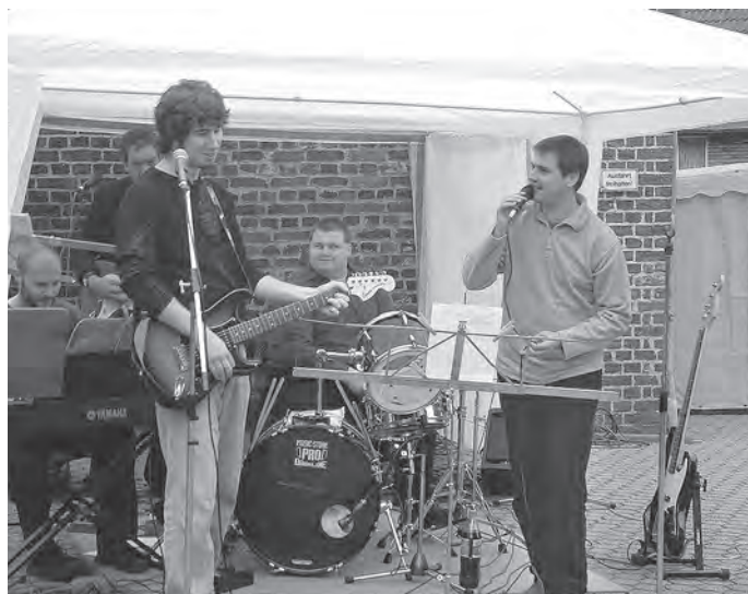
„Die Band“ bei einem ihrer ersten Auftritte

So war „Die Band“ geboren und probte zum Leidwesen aller Marienburger ein bis zwei Mal die Woche im Chorraum, erstes Obergeschoss im Martin-Luther-Haus. Mit selbstgebauten Lautsprecherboxen, Minimalausstattung und viel Enthusiasmus ging es ans Werk. Aber wo kann man proben, ohne dass die Musik fast bis zur Bonner Straße zu hören ist? Wo kann man das unhandliche Equipment lagern? Kann man es aufgebaut belassen? Antworten auf diese und viele andere Fragen bekamen wir nach Rücksprache beim Küster und dem damaligen Presbyterium und konnten dann den ursprünglich als Meditationsraum gedachten Bereich in der Jugendecke des Gemeindehauses als Proberaum nutzen.