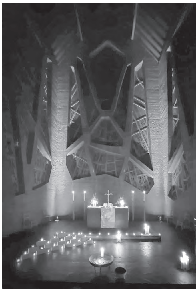
Der gestaltete Altarraum der Reformationskirche

Jede Vikarin, jeder Vikar plant während der Zeit in der Gemeinde ein Gemeindeprojekt, z. B. eine Veranstaltung, die es so bisher vor Ort noch nicht gegeben hat. Mit den Konfirmandinnen und Konfirmanden 2021 hätte ich gern in der Passionszeit eine „liturgische Nacht“ für die Gemeinde gestaltet, anschließend mit den Jugendlichen in der Kirche übernachtet und das Erlebte mit einem Frühstück ausklingen lassen. Wir hätten den Kirchneraum mit unserem Leben und Erleben gefüllt, optisch, akustisch und gestalterisch. – Leider ist es anders gekommen. Coronabedingt durften wir den Konfirmandenunterricht nicht mehr in Präsenz abhalten, eine Übernachtung ist in weite Ferne gerückt, eine gemeinsame Vorbereitung als Gruppe in der Kirche war nicht möglich. Und dass alle Konfis zusammen mit Angehörigen und Gemeinde Gottesdienst feiern oder Menschen sich über Stunden in größerer Zahl in einer Kirche aufhalten, ließen die Auflagen für Gottesdienste nicht zu. Also wurde aus der Ursprungsplanung eine Passionsandacht auf andere Weise – überwiegend online und digital in Gruppen vorbereitet, vor Ort ge-