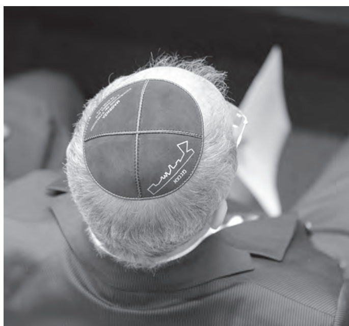
Kippa-Solidaritätsaktionen in mehreren deutschen Städten

In der vorigen kontakte -Ausgabe haben wir bereits auf das Festjahr „1700 Jahre jüdisches Leben in Deutschland“ aufmerksam gemacht, bei dem im Rahmen von bundesweit rund 1000 Veranstaltungen das Ziel verfolgt wird, die Vielfalt jüdischen Lebens sichtbar und erlebbar zu machen und Begegnungen zwischen jüdischen und nichtjüdischen Menschen zu schaffen, um dem erstarkenden Antisemitismus entgegenzuwirken. Im Folgenden weisen wir auf einige ausgewählte Veranstaltungen hier in Köln hin: