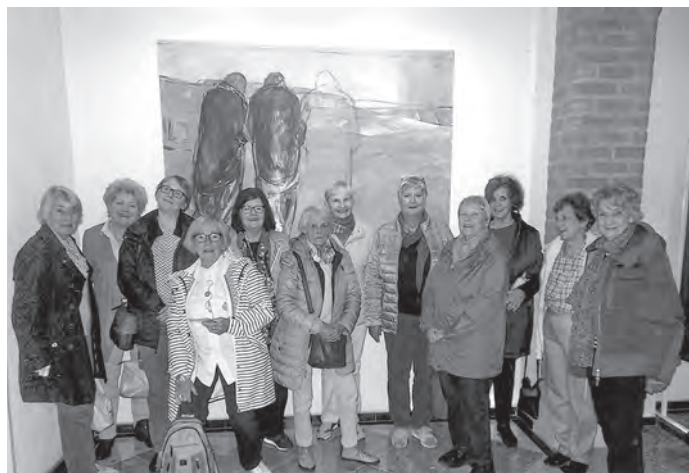
TEE UND MEHR in der Abtei Kornelimünster

Gerne erinnern wir uns an die Einkehr in dem Evangelischen Kloster Wennigsten bei Celle. Dieses Kloster wird von evangelischen Stiftsdamen (eine geistliche Frauengemeinschaft) betreut. Die Begegnungen und die großartige Gastfreundschaft sind einfach unvergesslich geblieben. Am folgenden Sonntag haben wir auch hier mit einem Gottesdienst einen für uns stärkenden Abschluss gefunden. Bei strahlendem Sonnenschein stand dann noch eine Besichtigung der Stadt Celle auf dem Programm.