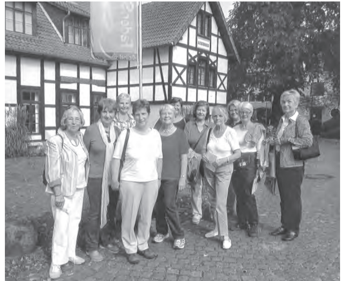
TEE UND MEHR in Bethel

Verbundenheit faire Gespräche und Diskussionen und zum Abschluss eine Messfeier. Das gemütliche Beisammensein am Abend war für uns hierbei ebenfalls sehr wichtig.